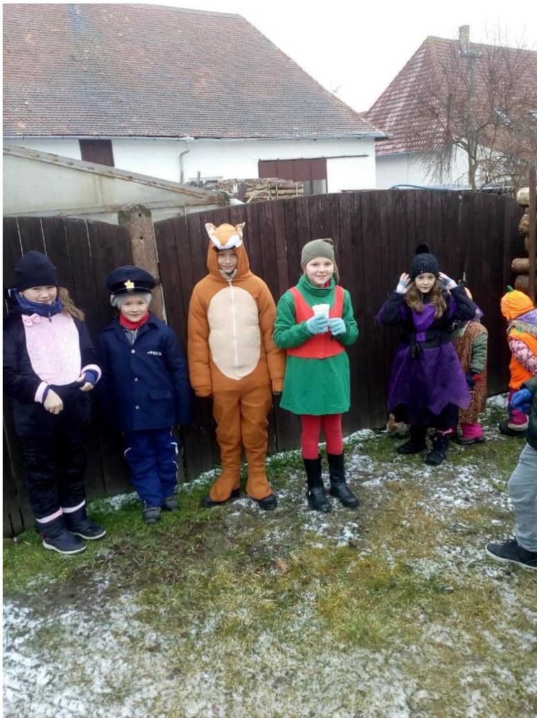
Masky si děti užily také na Masopustu, kterého jsme se zúčastnili.