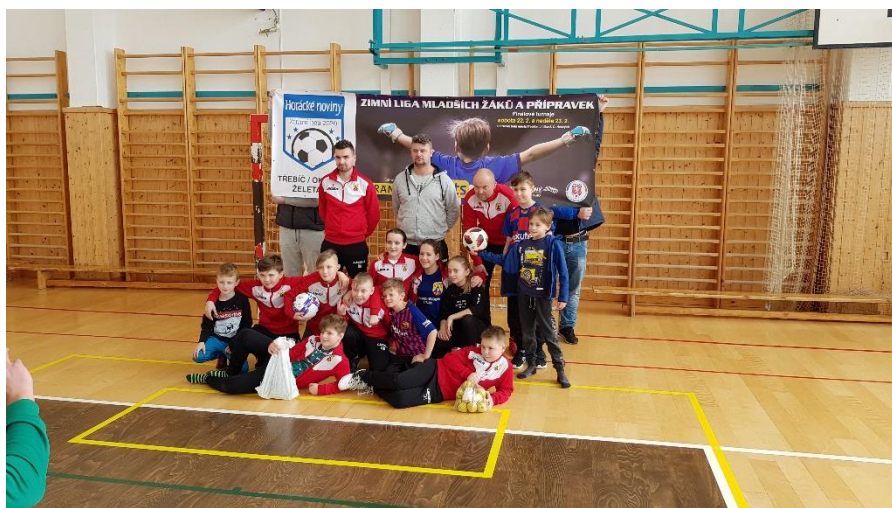
1.místo starší přípravka (Turnaj - Zimní liga 2019)