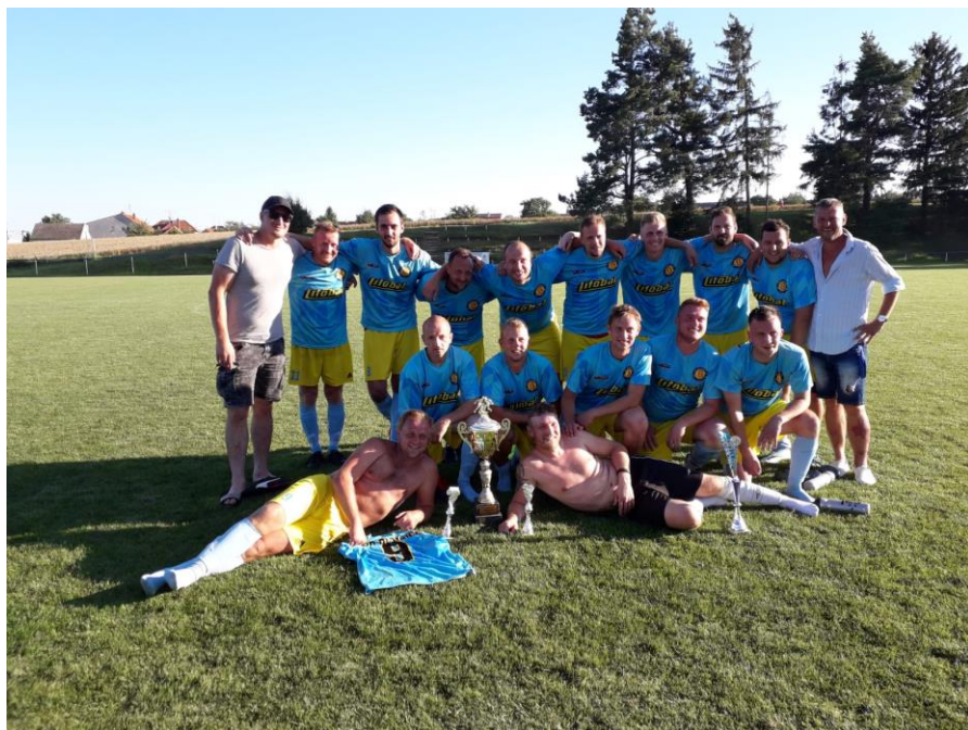
1. místo (Morava cup – Výčapy 2020)