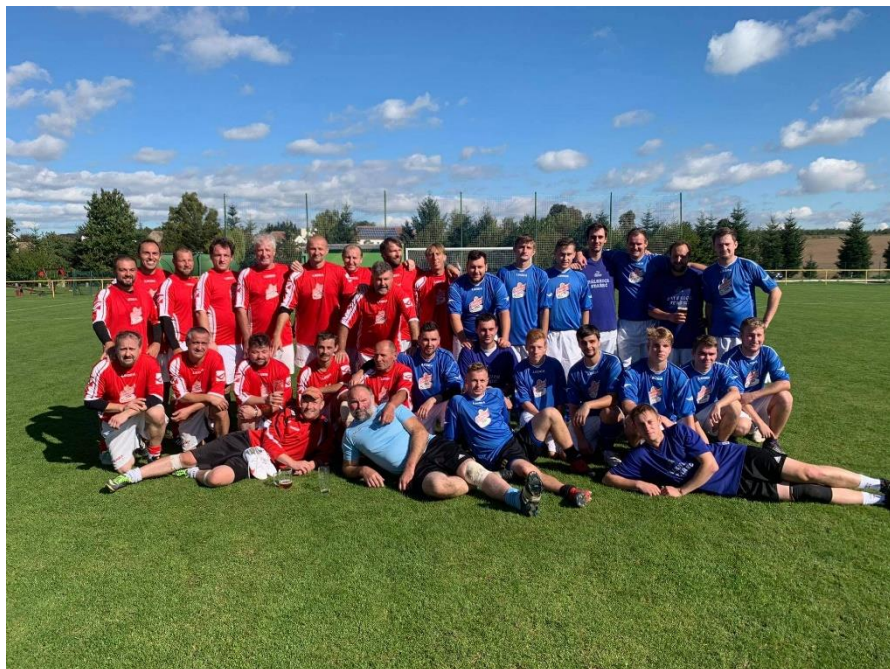
Svobodní – Ženatí (Posvícení 2020)