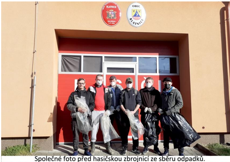
Společné foto před hasičskou zbrojnicí ze sběru odpadků.

Naši hasiči se také podíleli na akci „Čistá Vysočina“ sběrem odpadu kolem komunikací.