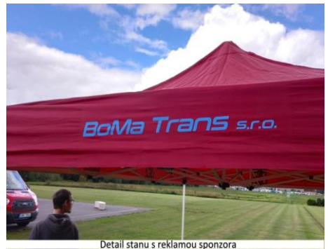
Detail stanu s reklamou sponzora

Naši hasiči se také podíleli na akci „Čistá Vysočina“ sběrem odpadu kolem komunikací.