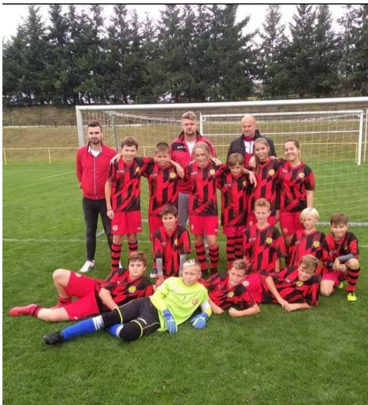
Mladší žáci (podzimní část sezóny 2021/2022)