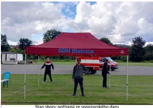
Stan sboru pořízený ze sponzorského daru

V prostorách naší zbrojnice se uskutečnila společenská akce, která byla poděkováním všem našim podporovatelům a sponzorům.