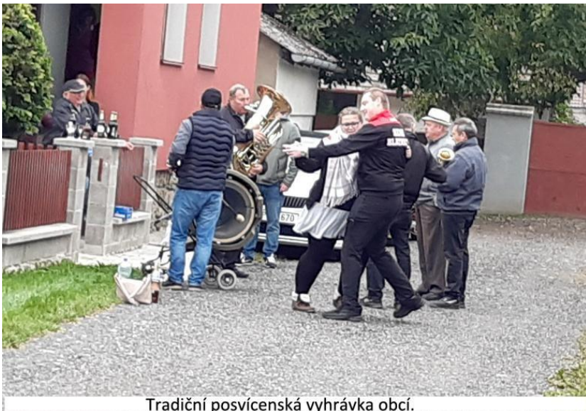
Tradiční posvícenská vyhrávka obcí.

Bohužel, začátek roku byl ještě v různých epidemických omezeních, což nám zamezilo pořádání masopustního veselí. Po ustálení situace a následném rozvolnění, jsme na blatnické posvícení zorganizovali dvě posvícenské zábavy. V neděli proběhla mše a tradiční vyhrávání po obci. Všechny tyto akce se velmi vydařily a mile nás překvapila vysoká účast.